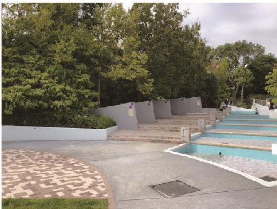
3 Go up the stairs