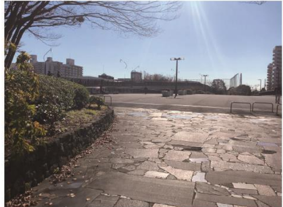
6 Cross the Shinsakon bridge and turn left