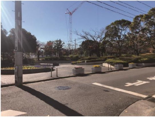
1 Pass through Shinden 6gou Park in front of the main building