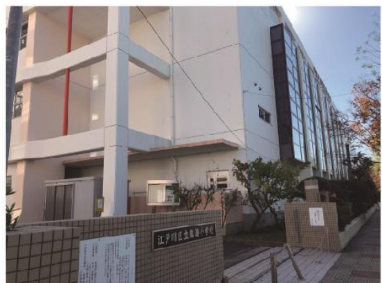
8 Cross the intersection, you find the Rinkai elementary school on your left