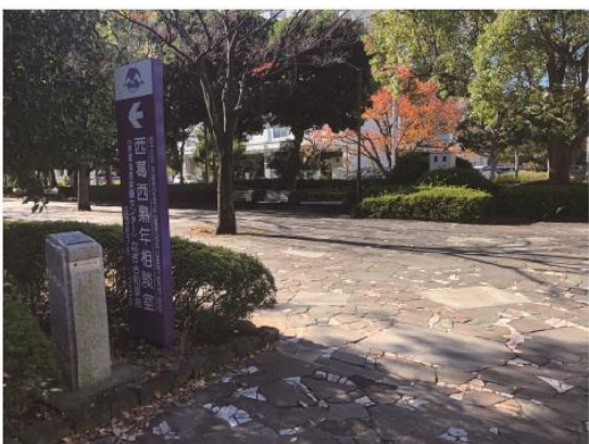
4 At the end of the stairs, turn left