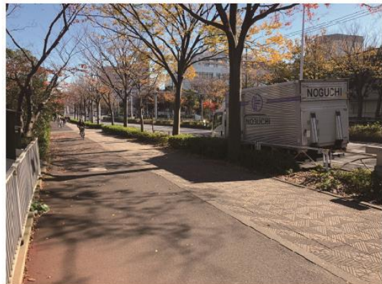
7 Turn left and go straight to the first intersection