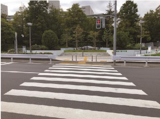
2 Head to Shinnagashimagawa Shinsui park