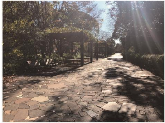
5 Go south for a while