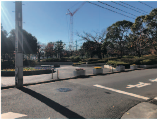
1 本校舎前新田6号公園を通り抜けます。