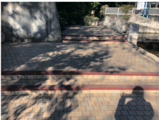
3 噴水の奥の階段を上がります。