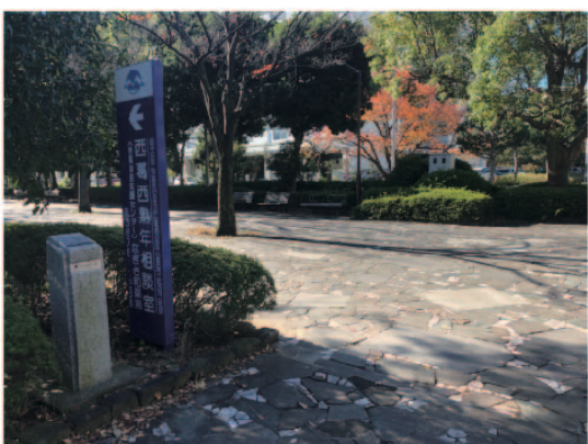
4 階段を上りきったところで左に曲がります。