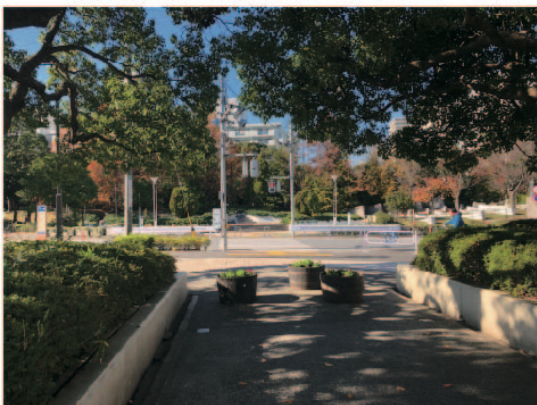
2 新長島川親水公園の噴水に向かいます。