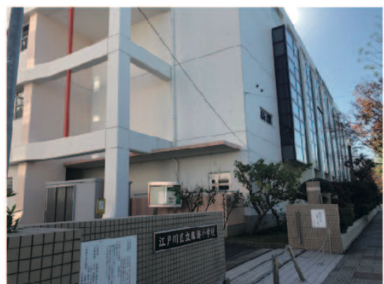
8 交差点を渡ると左側に臨海小学校があります。