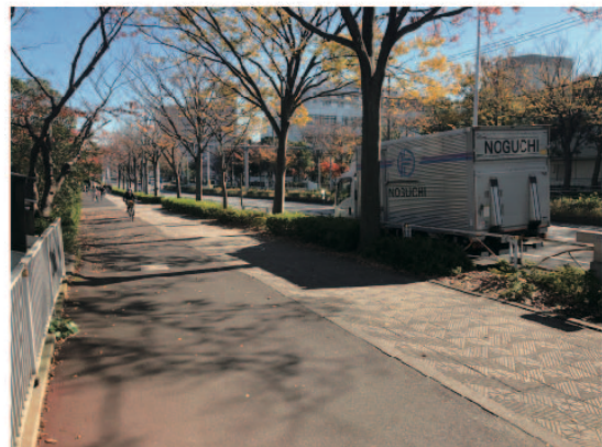
7 左に曲がり、一つ目の交差点まで進みます。