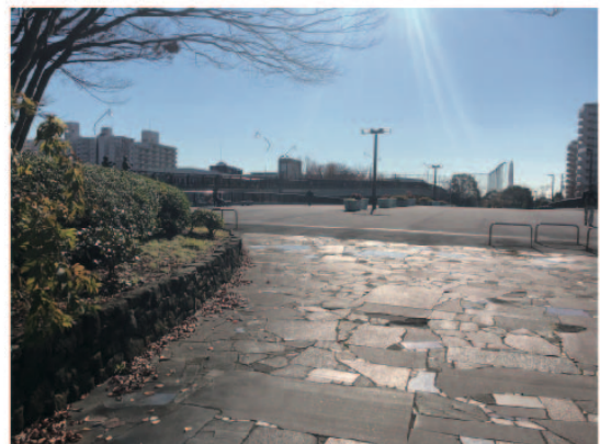
6 新左近橋を渡り、左に曲がります。