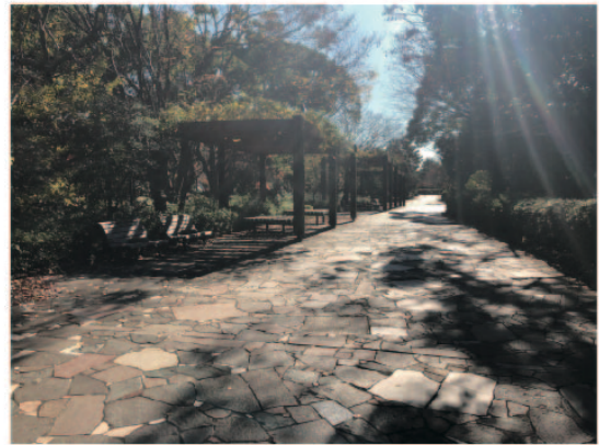
5 南にしばらく進みます。