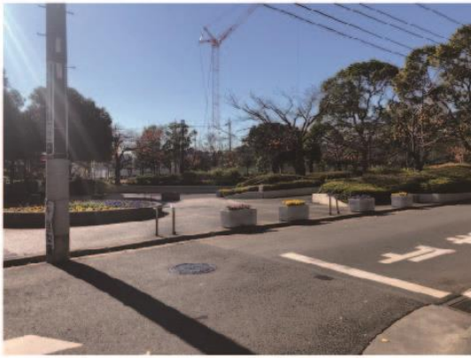
1. 穿越本校舍前的新田 6 號公園。