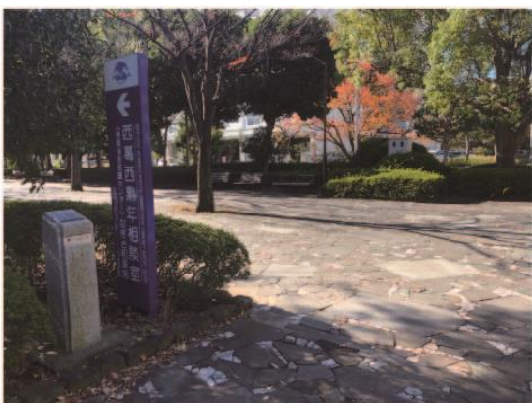
4. 爬上樓梯後往左轉。