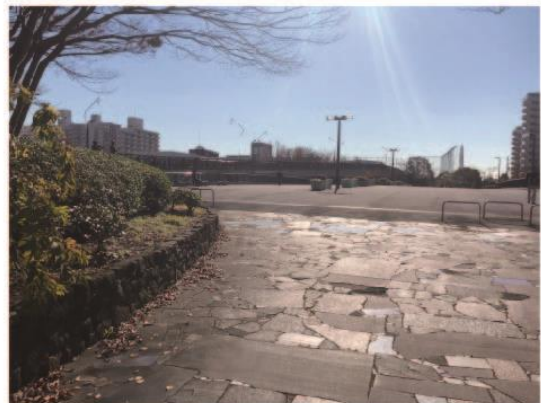
6. 穿過海鷗橋後往左轉。