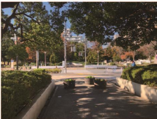
2. 往新長島川親水公園的噴水池方向前進。