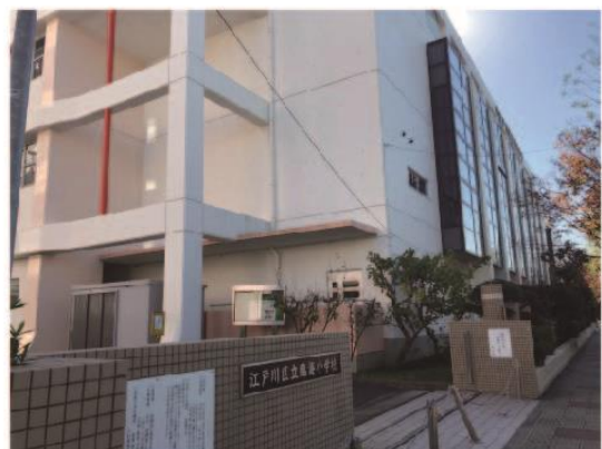
8. 穿過紅綠燈後，左邊就是臨海小學。