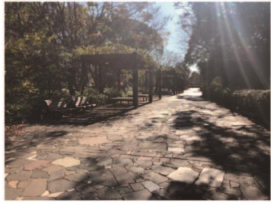
5. 往南邊的方向前進。