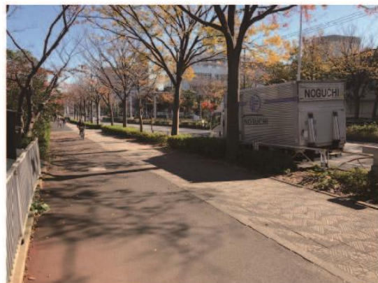
7. 往左轉後，往前進走到看到第二個紅綠燈為止。